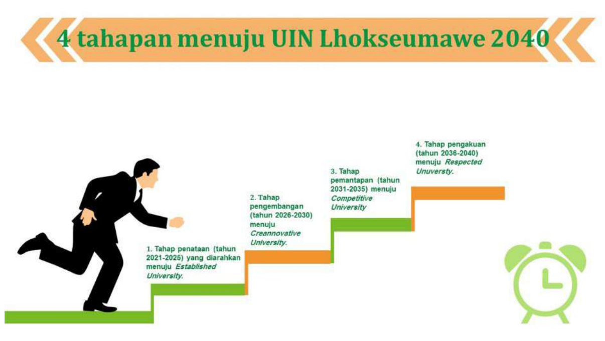
Gambar 1: Roadmap UIN Al Malik Ash Shalih menuju visi 2040

Untuk mewujudkan UIN Al Malik Ash Shalih menjadi perguruan tinggi yang memiliki keunggulan tertentu dalam bidang sains yang terintegrasi dengan kearifan lokal sehingga diakui secara ASEAN dan dijadikan rujukan oleh perguruan tinggi lain, maka dirumuskan dalam roadmap . Roadmap terbagi dalam tahapan sesuai dengan periode perencanaan Rencana Strategis yang dimulai pada tahun 2021 dan mengacu pada teori Bruce Tuckman. Berikut adalah gambar menunjukkan roadmap UIN Al Malik Ash Shalih menuju visi 2040: