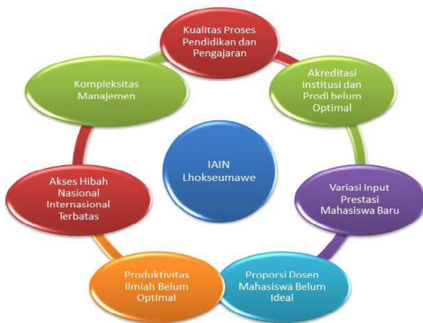
Gambar 3 Tantangan Kelembagaan dan Manajemen IAIN Lhokseumawe

Menghadapi ketiga tantangan tersebut, IAIN Lhokseumawe perlu secara terus-menerus dan berkesinambungan meningkatkan produktivitas ilmiah dan kualitas reputasi akademiknya, yang diarahkan guna mengurai permasalahan kesejahteraan umat sekaligus mengusung pengembangan integrasi ilmu untuk umat. Sedangkan tantangan kelembagaan dan manajemen IAIN Lhokseumawe dapat digambarkan sebagai berikut: