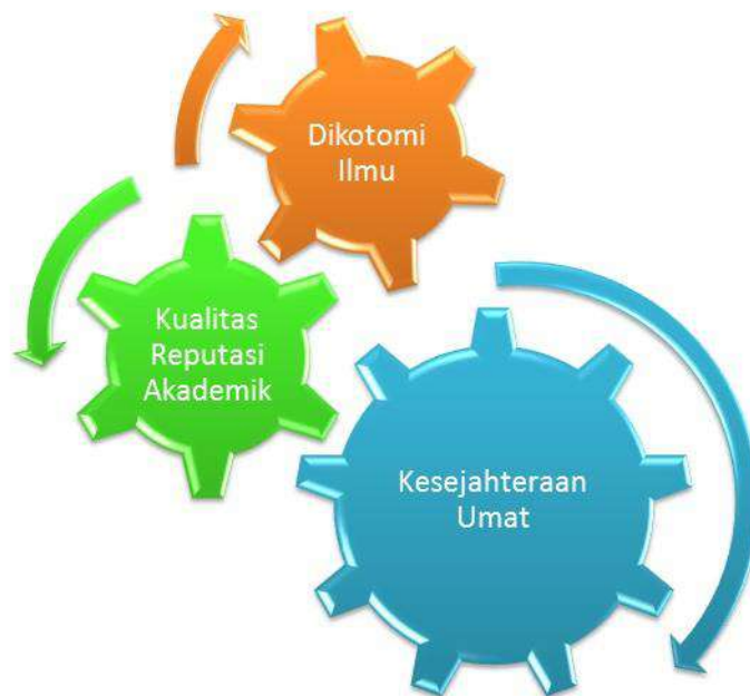
Gambar 2 Tantangan Pendidikan Tinggi Islam

Adapun faktor eksternal, yaitu kondisi objektif di luar IAIN Lhokseumawe yang bersifat uncontrollable , akan menjadi bagian dari tanggung jawab IAIN Lhokseumawe dalam penyelesaian masalah-masalah tersebut. Oleh karena itu, dalam konstalasi pendidikan tinggi, IAIN Lhokseumawe harus siap berhadapan dengan tantangan kemajuan ilmu pengetahuan, dan problematika umat dan kebangsaan. Tantangan yang dimaksud, dapat digambarkan sebagai berikut: